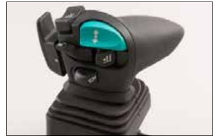
Control hidráulico multiPILOT (opcional)