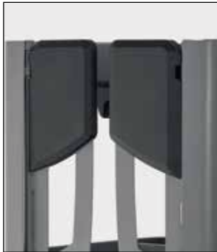
Puertas acojinadas para fácil entrada y comodidad del operador