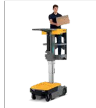
Estable aún en la altura completa