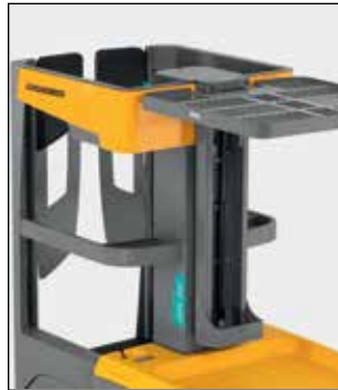
Controles y bandeja de almacenamiento a la vista todo el tiempo