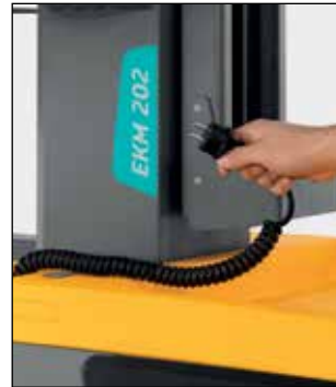
Cargador a bordo con cable espiral integrado